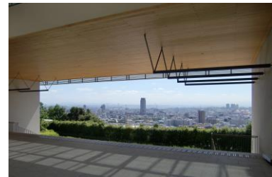
百年記念館からの景色

文学部 、 理学部 、 農学部 、 工学部 がある六甲台第2キャンパスの名物は、百年記念館と「うりぼーロード」です。百年記念館からの眺望は見事です。ここから神戸市街や神戸港を一望できます。「うりぼーロード」は工学部と理学部の段差を縫うようにして、鶴甲第1キャンパスとをつなぐ歩行者専用通路として南北に整備された空中回廊です。六甲山系を臨みながら学内の馬場を眺めることができます。馬場の北に位置する学生会館はクラブ活動の拠点となっており、夕方になるとたくさんの学生が楽器の練習をする姿がみられます。最上階ホールのテラスからは視界270度のパノラマを楽しむことができます。