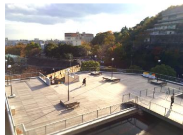
A棟1階 ウッドデッキ

国際人間科学部 は鶴甲第1キャンパスと鶴甲第2キャンパスに分かれています。鶴甲第1キャンパスには、2015年4月に緑鮮やかな人工芝グラウンドが誕生しました。A棟の1階部分には巨大なウッドデッキがあり、待ち合わせをするのに最適です。国際人間科学部のもう一つのキャンパスである鶴甲第2キャンパスは標高200メートル以