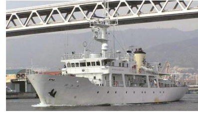
海事科学研究科附属 練習船（深江丸）

海事科学部 のある深江キャンパスは海に面しており、全国の大学でもきわめて珍しく、キャンパス内に船舶が停泊できる港湾施設をもっています。大学が所有する練習船やヨットは演習などに活用されています。全学共通授業科目では海事科学部以外の学生にも乗船できる機会がありますので、関心のある人はぜひ参加するとよいでしょう。