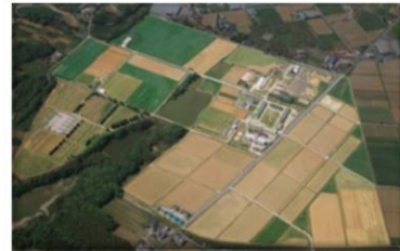
農学研究科附属食資源教育研究センター

医学部医学科 のある楠キャンパスは、平安時代末期に都が置かれた福原京の中心地に位置し、新開地や湊川神社など、神戸の歴史が感じられる地域にあります。 医学部保健学科 はニュータウンとして開発された名谷にあります。山と海に挟まれた神戸の細長いイメージとは異なり、一面の丘陵地帯が視界に広がっています。加西市にある 農学研究科附属食資源教育研究センター には40ヘクタールの敷地に水田、畑、果樹園、牛舎などがあり、教育・研究活動を行うと同時に、さまざまな生産物を出荷しています。その様子は神戸大学ホームページ（ 動画 de 神大 ）で見ることができます。